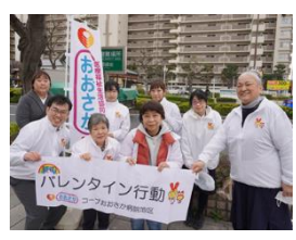
愛あふれる集合写真

寒の戻りで風の冷たい一日となってしまいましたが、職員と組合員で寒さを吹き飛ばす行動でした。